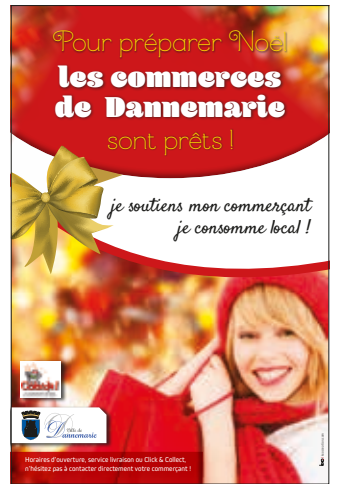
Liste non exhaustive, présentation des commerçants ayant répondu à notre sollicitation de parution (gratuite) de leur logo.

Malgré ses moyens limités, Dannemarie reste aux côtés de ceux qui font vivre l'économie locale en cette période difficile. N'hésitez pas à pousser la porte de nos commerces et à découvrir leur savoir-faire et leurs produits.