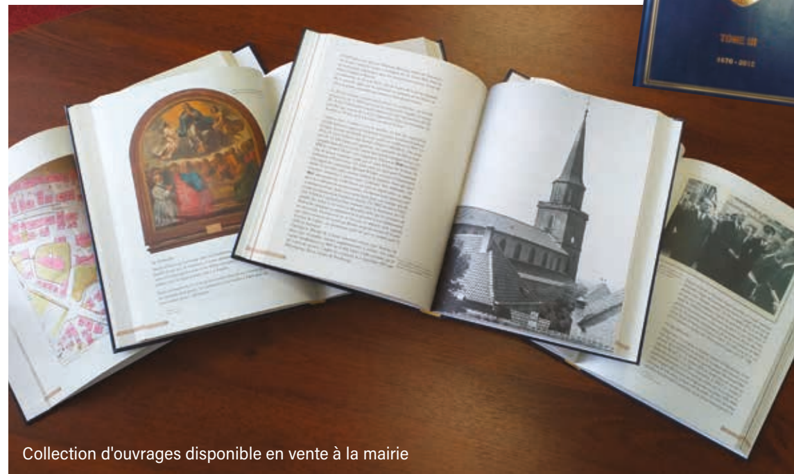
Collection d'ouvrages disponible en vente à la mairie