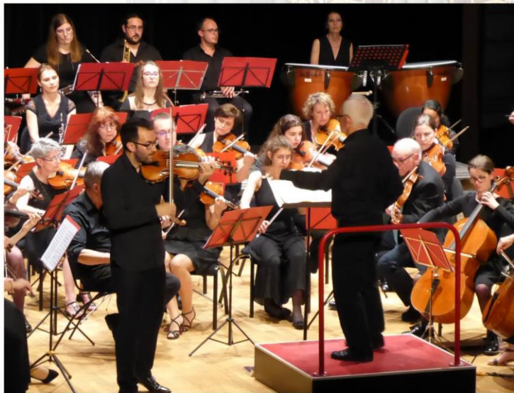
Orchestre Saint Colombar (Luxeuil)

Le requiem : une composition à plusieurs mains